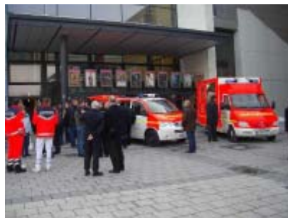
Fahrzeugübergabe beim CINEMAXX

Kooperationsverträge zur Ausbildung von Personal im Rettungsdienst wurden mit der Wehrbereichsverwaltung West in Düsseldorf für die Bundeswehr und mit den Evang. Ausbildungsstätten der von-Bodelschwingschen-Anstalten Bethel geschlossen.