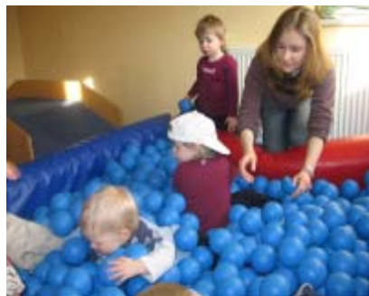
Bewegungsspiele sind für die Entwicklung der Kinder wichtig.

Durch unterschiedlichste Formen der Elternarbeit, wie z. B. Elternfrühstück, Eltern- Kind Nachmittage, gemeinsame Ausflüge und Spiele, Aktionen mit Eltern und Elternsprechtag, wird versucht eine Vertrauensbasis zu den Eltern aufzubauen. Auf Gruppenebene können die Eltern aus verschiedenen Angeboten auswählen, an denen sie sich beteiligen möchten. So ist gewährleistet, dass alle Eltern die Möglichkeit haben an einer Aktion teilzunehmen.