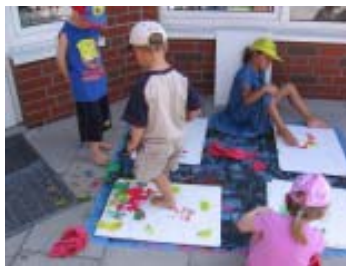
„Malen mit Füßen- junge Künstler in ihrer Entwicklung

Unsere diesjährigen Teamtage mit einer Referentin, beinhalteten die Fortbildung zur Leuener Engagiertheitsskala, Beobachtung und Begleitung von Kindern . Zur Qualitätsentwicklung erarbeiteten wir uns die Kapitel „Verhaltens, Entwicklungsbeobachtung und Entwicklungsförderung“, sowie „die Angebotstruktur“.