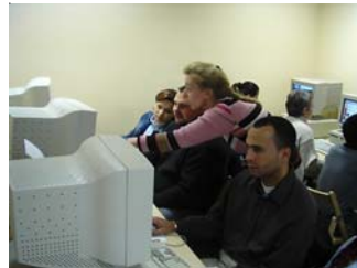
Teilnehmer aus verschiedenen Ländern im Deutschkurs

Das Bildungswerk konnte im Jahr 2005 die Kurssparte „Deutsch als Fremdsprache“ deutlich ausbauen. Die im Jahr 2004 begonnene Aqise neuer Maßnahmen zur Sprachqualifikation in geschlossenen, von Arbeitplus finanzierten Kursen war erfolgreich. Dieser neue Bereich - DAF II – erscheint in der Jahresübersicht mit über 3000 Unterrichtsstunden als derzeit stärkster Bereich.