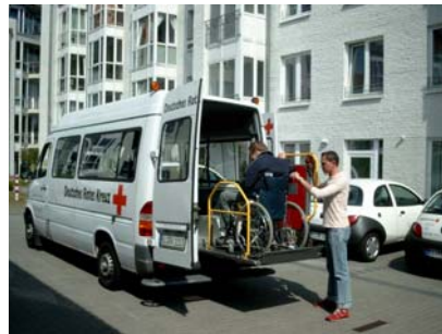
Die Fahrt mit dem DRK BTW ist für Rollstuhlfahrer oftmals die einzige Möglichkeit „in die Stadt“ zu kommen.

Zum Oktober 2005 wurden erstmals zwei eigene Ausbildungsplätze geschaffen um jungen Menschen eine Perspektive in dem interessanten Berufsbild „Altenpflegerin“ zu geben.