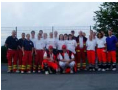
Die Einsatzkräfte beim Elton-John- Konzert

Das Geschäftsfeld Sanitätsdienste zeigte eine stetige Nachfrage nach Betreuung von Veranstaltungsteilnehmern und -besuchern, die mittels behördlicher oder verbandlicher Auflagen Rettungsdienstfachpersonal notwendig hatten. Die Menge der betreuten Veranstaltungen ist mit 190 gegenüber 2004 gleich geblieben.