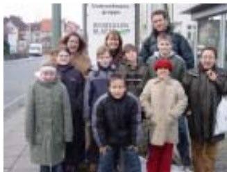
Teilnehmer des Medienprojektes vor dem Westfalen-Blatt-Pressenhaus

Denn „Jung und Alt entdecken Medienwelten“ war auch das Motto eines großen Medienprojektes, welches Kinder, Jugendliche und ältere Menschen zusammen brachte. In dem, von der Aktion Mensch geförderten Projekt, erwarben die jugendlichen Teilnehmer Medienkompetenzen, die sie direkt in die Tat umsetzten. So entstand eine Internetseite, eine Radiosendung und ein Videoclip. Gemeinsam mit älteren Menschen aus Sennestadt wurde dann noch eine Radiosendung produziert und ein Besuch der WDR Fernsehstudios in Köln durchgeführt.