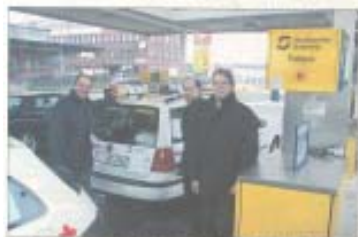
Das DRK-Bereitschaftsauto in Bielefeld. Die DRK-Bereitschaften sind die wichtigste Hilfe bei der Bewältigung von Katastrophen. Um die Einsatzfähigkeit der Einsatzkräfte zu gewährleisten, sind die Fahrzeuge des DRK in Bielefeld auf einen Stand von 1000 bis 1200 Fahrzeugen zu halten.

Bielefeld. Die DRK-Bereitschaften sind die wichtigste Hilfe bei der Bewältigung von Katastrophen. Um die Einsatzfähigkeit der Einsatzkräfte zu gewährleisten, sind die Fahrzeuge des DRK in Bielefeld auf einen Stand von 1000 bis 1200 Fahrzeugen zu halten. Um die Einsatzfähigkeit der Fahrzeuge zu gewährleisten, sind die Fahrzeuge des DRK in Bielefeld auf einen Stand von 1000 bis 1200 Fahrzeugen zu halten. Um die Einsatzfähigkeit der Fahrzeuge zu gewährleisten, sind die Fahrzeuge des DRK in Bielefeld auf einen Stand von 1000 bis 1200 Fahrzeugen zu halten.