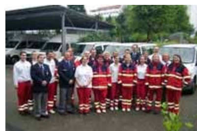
Rettungshelfer, Ausbilder und die Kreisrotkreuzleitung beim Abschluß

Das Foto zeigt Einsatzkräfte Rotkreuzgemeinschaft Bi-Mitte während einer Übung